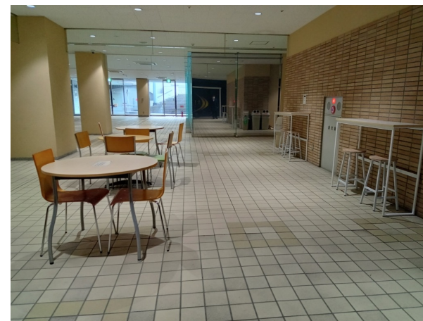
B1 イートインスペースあり